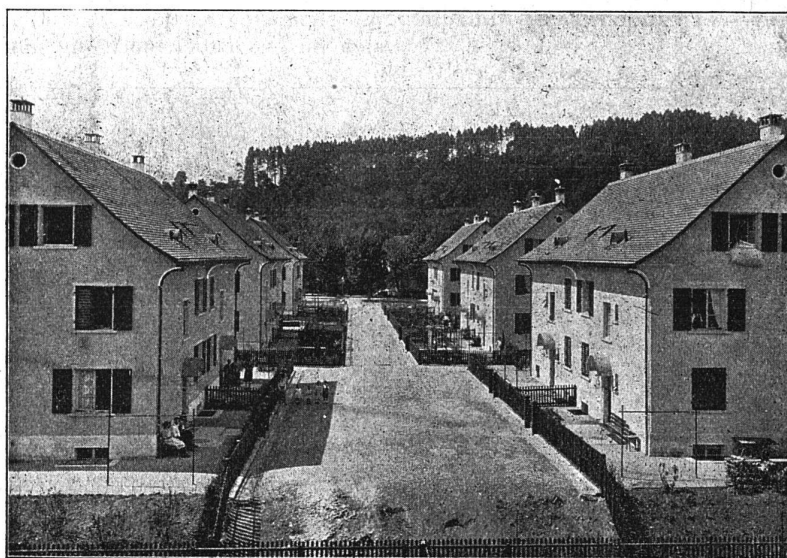
Zum Artikel: Das Mehrfamilienhaus. — Bleicherwiese-Wartstr., Winterthur.

terrichten, wird die Aufgabe der nächsten Zeit sein.