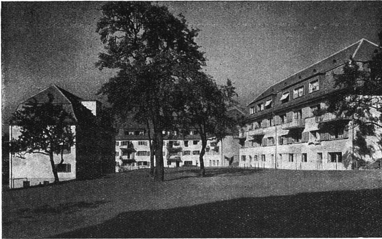
Gemeinn. Baugenossenschaft „Waidberg“ Zürich Kolonie an der Geibel- u. Rosengartenstr.

begrenzten Erfolgen begleitet sind. Es bleibt also nur noch als einzig wirksames Mittel die Tragung eines möglichst grossen Teiles des Bauaufwandes aus öffentlichen Mitteln. Die Bautätigkeit der Gemeinde Wien stellt den grosszügigsten und erfolgreichsten Versuch auf diesem Gebiete dar.