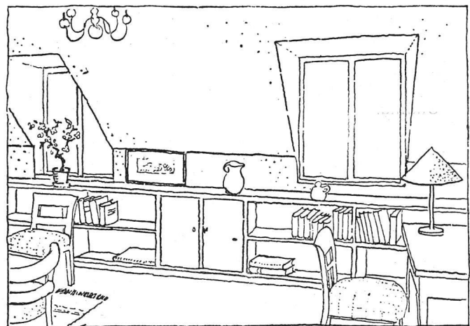
Vorderansicht der Mansarde

front etwas kahl, so stelle man eine einzelne Topfpflanze in die Mitte vor das Fenster, oder auf jede Seite des Fensterrahmens einen Blumentopf mit Efeu, die Ranken werden dann schnell emportreiben und können dann beliebig nach Geschmack geordnet werden.