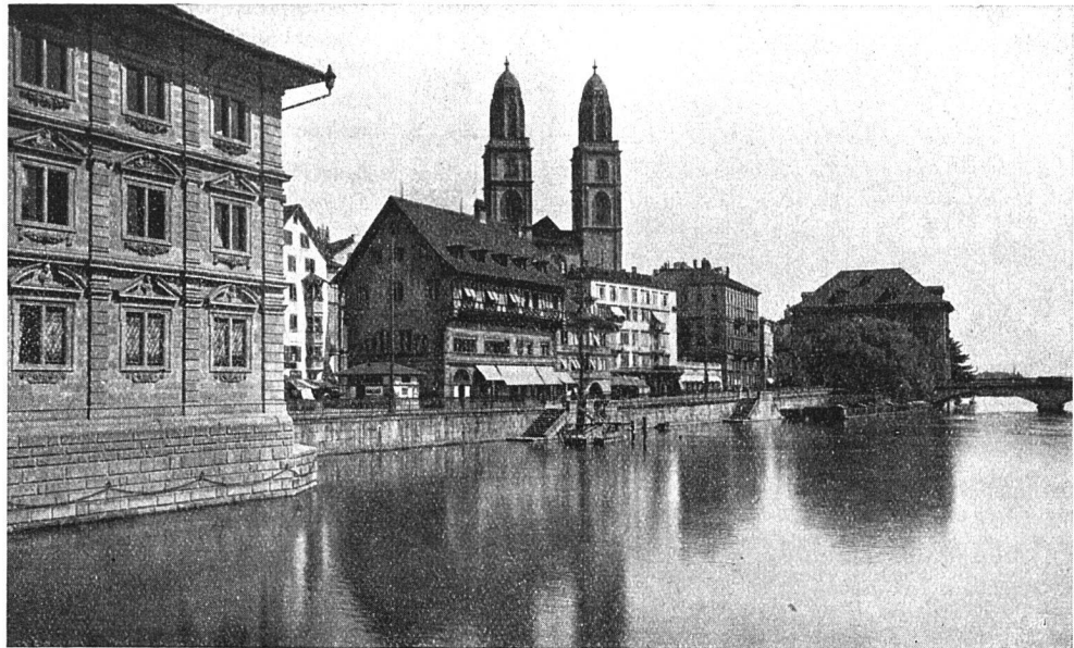
Zürich, Rathaus mit Blick gegen Großmünster und Helmhaus

Der Wohnungsbau hatte also ungefähr mit 2\frac{1}{2} fachen Kosten zu rechnen. Er war damit zu einer sehr wenig lockenden Angelegenheit geworden. Unter der Stagnation aber hatte vor allem der Mieter zu leiden. Die Zeiten mit Mietamt und Mieterschutz einerseits und zahlreichen Schikanen andererseits sind noch allzugut in Erinnerung, als daß wir daran erinnern müßten. An den Bau von Wohnungen aber wagten sich schließlich, gedrängt von der Not der Mieterschaft, die gemeinnützigen Baugenossenschaften heran. Sie übernahmen damit ein großes Risiko, denn es war anzunehmen, daß der Baukostenindex im Laufe der Zeit wieder sinken und damit ein »verlorener Baukostenaufwand« entstehen würde, der die Genossenschaften stark belasten, sie vielleicht gefährden könnte. In der Tat hat eine kürzliche Untersuchung der Bilanz einer größeren Baugenossenschaft gezeigt, daß nur dank einer sehr sparsamen und vorsichtigen Geschäftsführung, dank starker Abschreibungen und Reservestellungen der verlorene Aufwand für diese einzelne Genossenschaft wieder wettgemacht werden konnte. Auch die von Staat und Gemeinden seinerzeit gewährten Subventionen vermochten nicht, den ganzen Verlust,