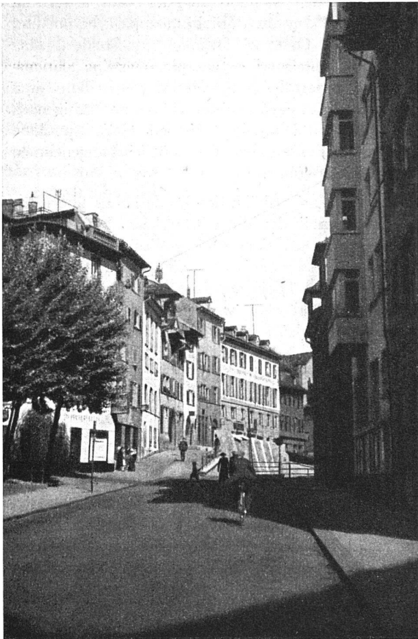
Die Spiegelgasse — einst

Das Berichtsjahr hat leider noch keine Wendung in den weltpolitischen Verwicklungen gebracht, damit ist zugleich gesagt, daß auch unser Land nach wie vor auf stärkste Weise die Auswirkung dieser Krise zu spüren bekommt. Jedem Einsichtigen ist zudem klar, daß, sollten die weltpolitischen Auseinandersetzungen noch lange dauern, auch wir in immer stärkerem Maße von den Folgen dieser Unordnung betroffen würden. In diesen Zeiten hilft nur eines: die restlose Verwirklichung des Solidaritätsgedankens, wie er in der Tatsache des jahrhundertelangen Bestehens unseres Staatswesens, unserer Eidgenossenschaft als Aufgabe gestellt ist, wie er auch von unserer Bewegung, die ein Teil der großen Genossenschaftsbewegung ist, als Ziel aufgestellt worden ist. Für diesen Solidaritätsgedanken auf einem bestimmten wirtschaftlichen Gebiete einzustehen und ihn in die Tat umzusetzen, das haben unsere Baugenossenschaften von jeher als ihre vornehme Pflicht betrachtet. Ihre Erwartung, es müsse und solle dieser Gedanke der Solidarität in schwerer Zeit nicht auf einzelne Teilgebiete unseres staatlichen Zusammenlebens beschränkt bleiben, sondern zum Leitsatz der gesamten Lebensgestaltung gemacht werden, ist sicherlich berechtigt. Es geht heute nicht mehr an, daß der eine unverdiente Vorteile genießt, während der andere hungert und friert und kaum noch die Mittel aufbringt zur Bestreitung eines Wohnungszinses. In einer «be-