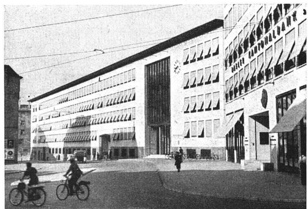
— und heute nach der kürzlich durchgeführten Korrektion