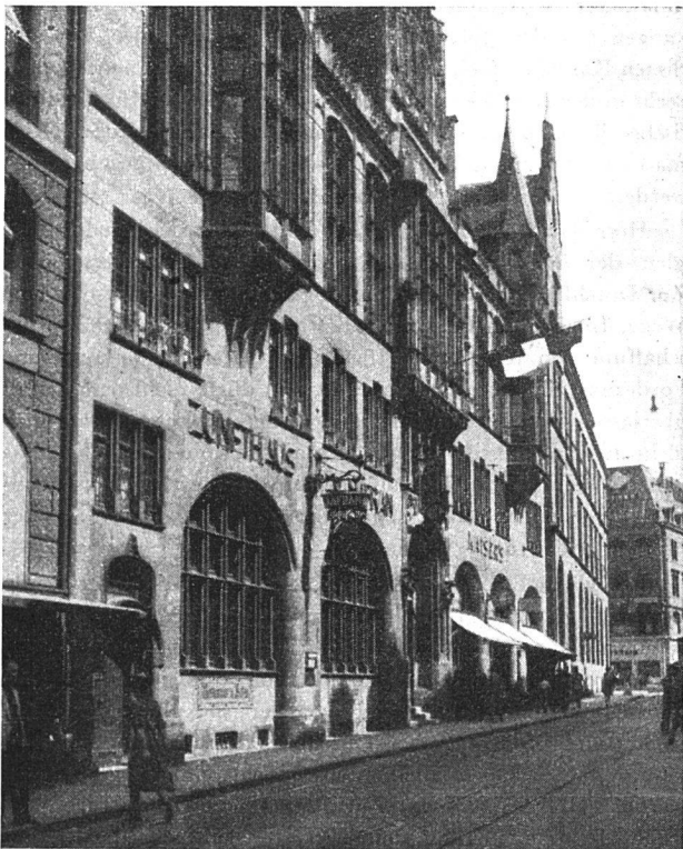
Der Ort der Arbeit —

Präsident Straub gibt bekannt, daß die Sektion Bern beantragt, das Beitragswesen im Verband solle grundsätzlich auf einen einheitlichen Boden gebracht werden. Der Zentralvorstand habe beschlossen, eine Vorlage auszuarbeiten, die der