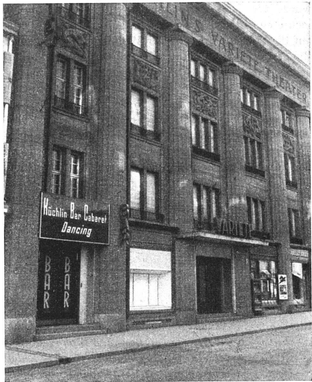
— und der Ort des Vergnügens