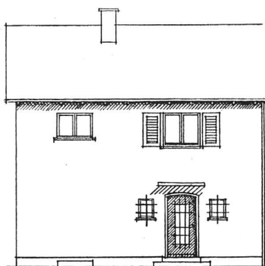
Ansicht von Norden

Im 1. Stock befinden sich zwei große Schlafzimmer, ein Badzimmer mit elektrischem Boiler und eine Toi-