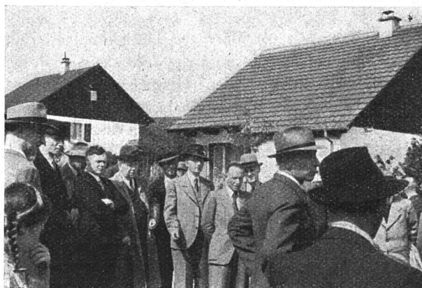
Die Kleinsiedlungen im «Löchligut» begegnen ausgesprochenem Interesse