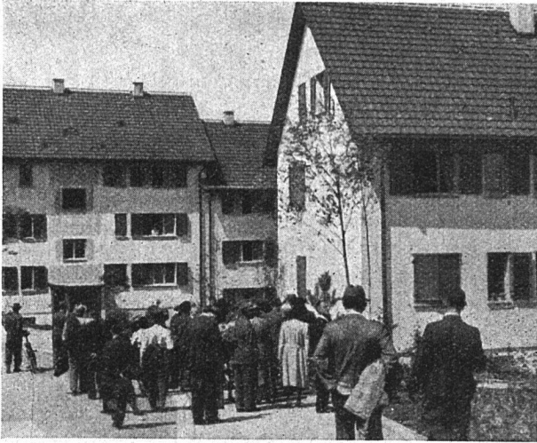
Das «Wylergut» überrascht durch seine freundliche Anlage