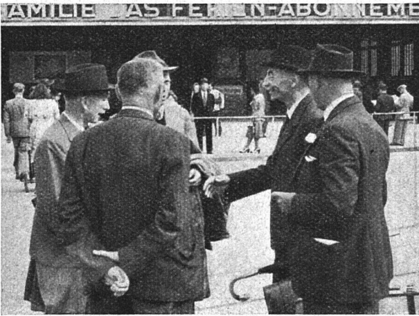
Und nur allzubald heißt es: Auf Wiedersehen!

mit, seinen Regenapparat nur für die kurze Zeit in Funktion zu setzen, da die Delegierten hübsch geborgen bei geschäftlichen Traktanden beisammen am «Schermen»