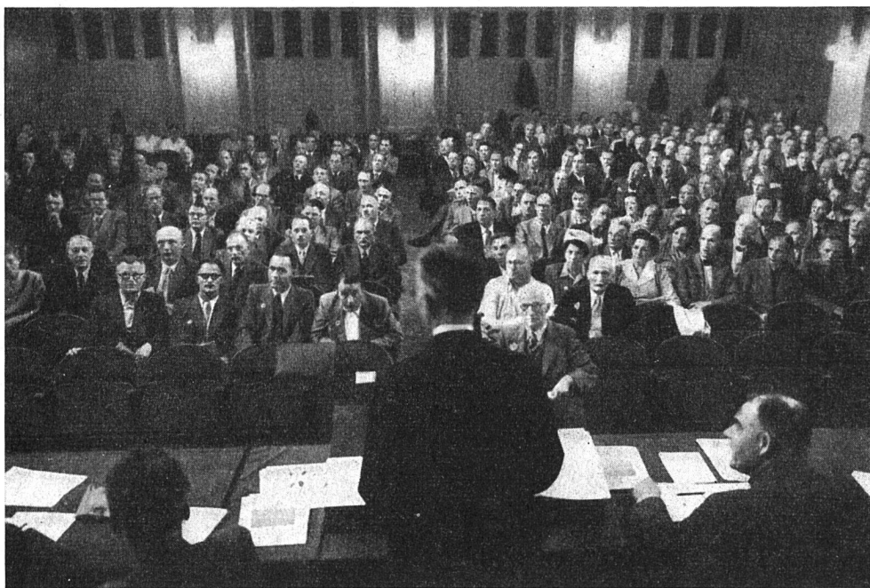
Der Schweiz. Verband für Wohnungswesen tagt in Olten

Wahlen in den Zentralvorstand . Zur Ergänzung des Vorstandes schlägt Präsident Straub die Herren Baldinger , Präsi-