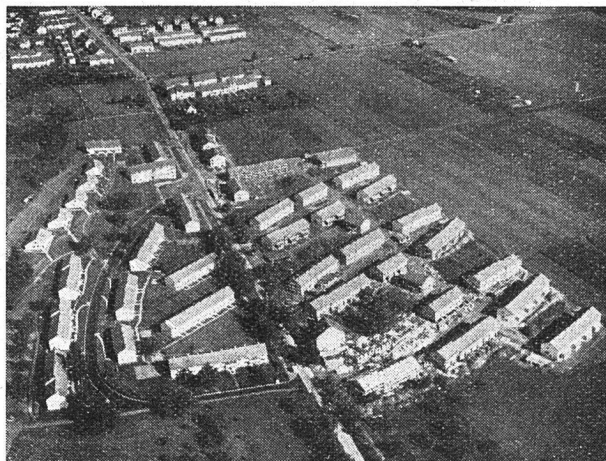
Fliegeransicht während der Bauzeit

Nachdem die Bauabrechnung bei den Subventionsbehörden eingereicht ist, wurde dieser Tage der Wohnbaukommission der Stadt Zürich ein neues Projekt für