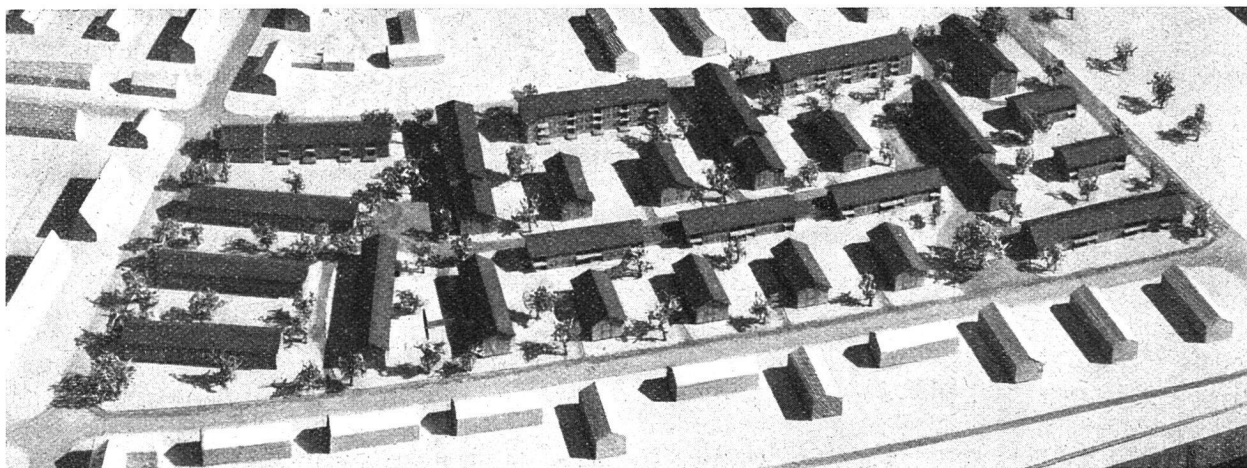
Gemeinschaftskolonie «Mattenbach», Architekt Spoerli, Ansicht der Kolonie von Süden

Eigenheim-Genossenschaft Winterthur Architekt: A. Kellermüller BSA/SIA (Obmann der Architekten-Gemeinschaft)