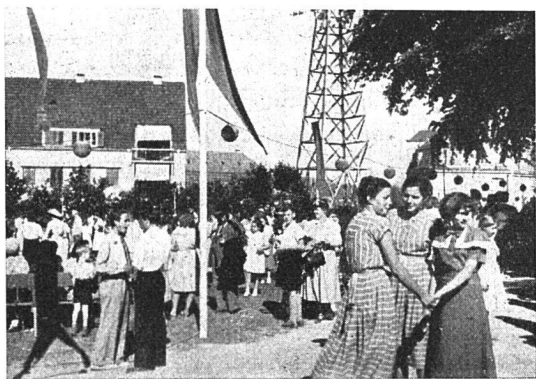
Ein Teil der Frohwiese. Zch.-Wollishofen

Hier nun wollen wir berichten, wie es andererseits auch erfreulich schöne und gute Beispiele gibt im Bestreben, diesem wichtigen Propagandatag der Genossenschaftsbewegung Form und Inhalt zu geben. So ist er in den letzten Jahren einigenorts zu einem wahren Volksfest geworden, auf das sich insbesondere die Kinder Wochen voraus schon freuen. Gerade die Baugenossenschaften mit ihren so gut sichtbaren Erfolgen genossenschaftlicher Zusammenarbeit, mit ihren Wohn-