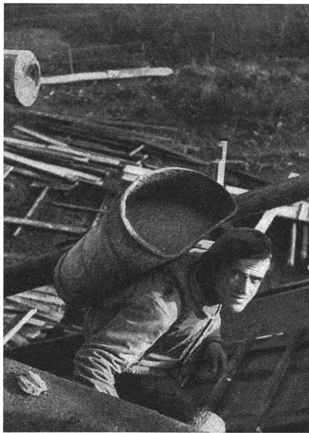
Ein Arbeiter der Abteilung «Hoch- und Tiefbau» des «Bau-Werk»

Aber wir haben schon erwähnt, daß der Arbeiter von seiner Genossenschaft nicht nur fordern darf. Er hat ihr seine Arbeitskraft mindestens so intensiv zur Verfügung zu stellen, wie es in einem anständigen Privatbetrieb der Fall ist. Für «Flohner» ist die Genossenschaft nicht da, denn gerade wenn man eine gewisse Freiheit, Verantwortung und die Abschaffung jedes Antreibersystems verlangt, muß ein Mindestmaß