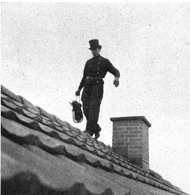
Der «Bau-Werk»-Kaminfeger turnt wie ein Akrobat auf dem Dach herum

Dann dürfen wir auch nicht vergessen, daß die heute bestehenden Genossenschaften sich in der kapitalistischen Wirtschaft zu behaupten haben, in welcher meistens derjenige Unternehmer Sieger bleibt, welcher über unbeschränkte Geldmittel verfügt. Das genossenschaftliche Bauunternehmen aber wird von den privaten Unternehmern mit wenig Ausnahmen als «böser Feind» betrachtet. Vor allem in der ersten Zeit