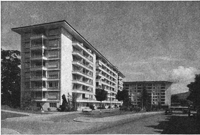
Siedlung Beaulieu, Block «Graphis II», 1950; Fr. Jenny, Architekt, und Gebrüder Honegger, Ingenieure und Architekten; im Hintergrund der Block «Graphis»

Die Vergleichung dieser Zahlen zeigt das enge Verhältnis zwischen der durchschnittlichen Zahl der Personen pro Haushalt und ihrer Zahl pro Wohnung. Wenn eine wesentliche Abweichung festzustellen ist, so handelt es sich um eine Periode der Wohnungsnot. Bei 3. und 4. stellt man fest, daß mit der Zahl von Bewohnern pro Haus Genf und Lausanne an der Spitze stehen. Für diese zwei Städte, wo die Statistik wahrlich