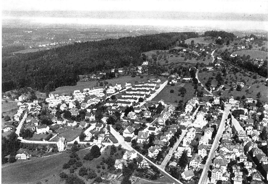
Stadt St. Gallen Rotmonten mit Blick auf den Bodensee

nicht in der Lage, die vermehrte Wohnungsnachfrage auch nur annähernd zu befriedigen. Die katastrophale Lage auf dem Wohnungsmarkt konnte deshalb nur mit öffentlichen Mitteln wirksam bekämpft werden. Diese Einsicht hat das St.-Galler-Volk in wiederholten Abstimmungen eindrücklich bewiesen. In den Jahren 1944 bis 1949 hat die öffentliche Hand (Bund, Kanton und Gemeinde) in der Stadt St. Gallen Barbeiträge von rund 12 Millionen Franken erbracht. Davon entfallen auf die Gemeinde St. Gallen rund 5 Millionen Franken. Dank diesen öffentlichen Mitteln sind große Leistungen vollbracht worden, an denen die Wohnbaugenossenschaften bedeutenden Anteil haben. Es darf mit Genugtuung festgestellt werden, daß durch diese Aktionen Wohnungen entstanden sind, die den Erfordernissen der Gesundheit und Hygiene und einer angemessenen Wohnkultur Rechnung tragen. Die Mietpreise des gemeinnützigen Wohnungsbaues sind