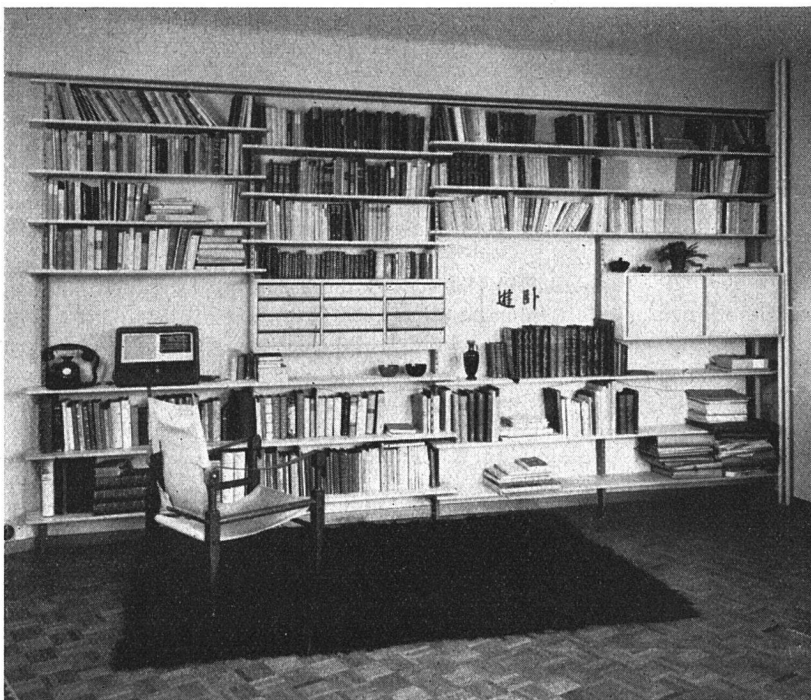
Abbildung rechts oben: Bücherwand mit Sitzgruppe Abbildung links: Bücherwand für Bibliothek- zimmer (siehe auch erste Umschlag- seite)