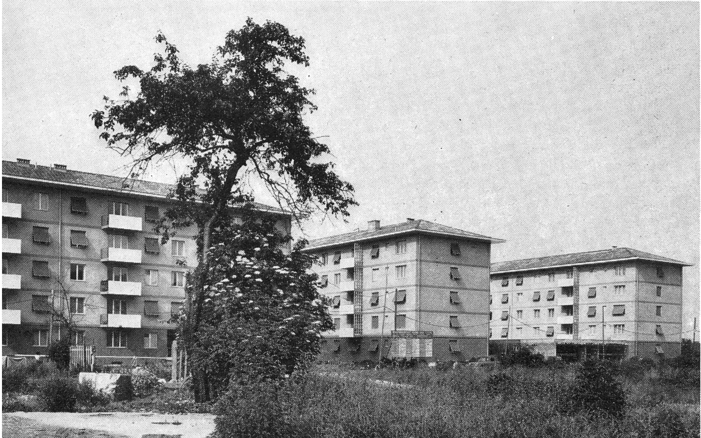
Häusergruppe der Baugenossenschaft «Solidar», Basel

Es hat in der Geschichte der Wohnbaugenossenschaften immer wieder Genossenschaften gegeben, die nach einer schönen ersten Etappe müde geworden sind. Die vielen Umtriebe der Vorstandsmitglieder, das Risiko, mit Neubauten neue Probleme lösen zu müssen, einer ungewissen Zukunft entgegenzugehen, hat schon Vorstände und Mitgliederversammlungen erlahmen lassen, nachdem einmal die Initianten selber mit preiswerten Wohnungen «versorgt» gewesen waren. Nicht so bei der «Solidar». An der Wiege dieses noch jungen Kindes des genossenschaftlichen Wohnungsbaues standen tatkräftige Eltern und schaffensfreudige Paten. Diesen Leuten ist es ein innerstes Be-