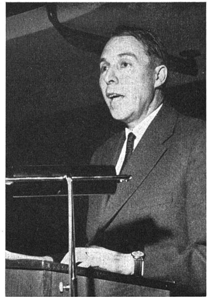
Prof. H. P. Tschudi, Regierungsrat Basel-Stadt