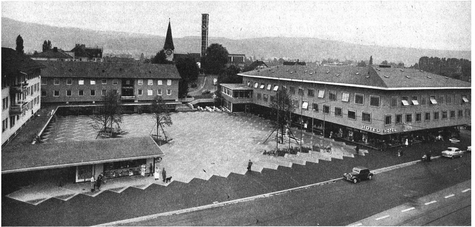
Gesamtansicht der Überbauung des Quartierkerns Altstetten durch die Initiativgenossenschaft Lindenplatz. Links ein Wohn- und Geschäftshaus als erste Etappe; rechts der Saalneubau, umgeben von Läden, Restau-