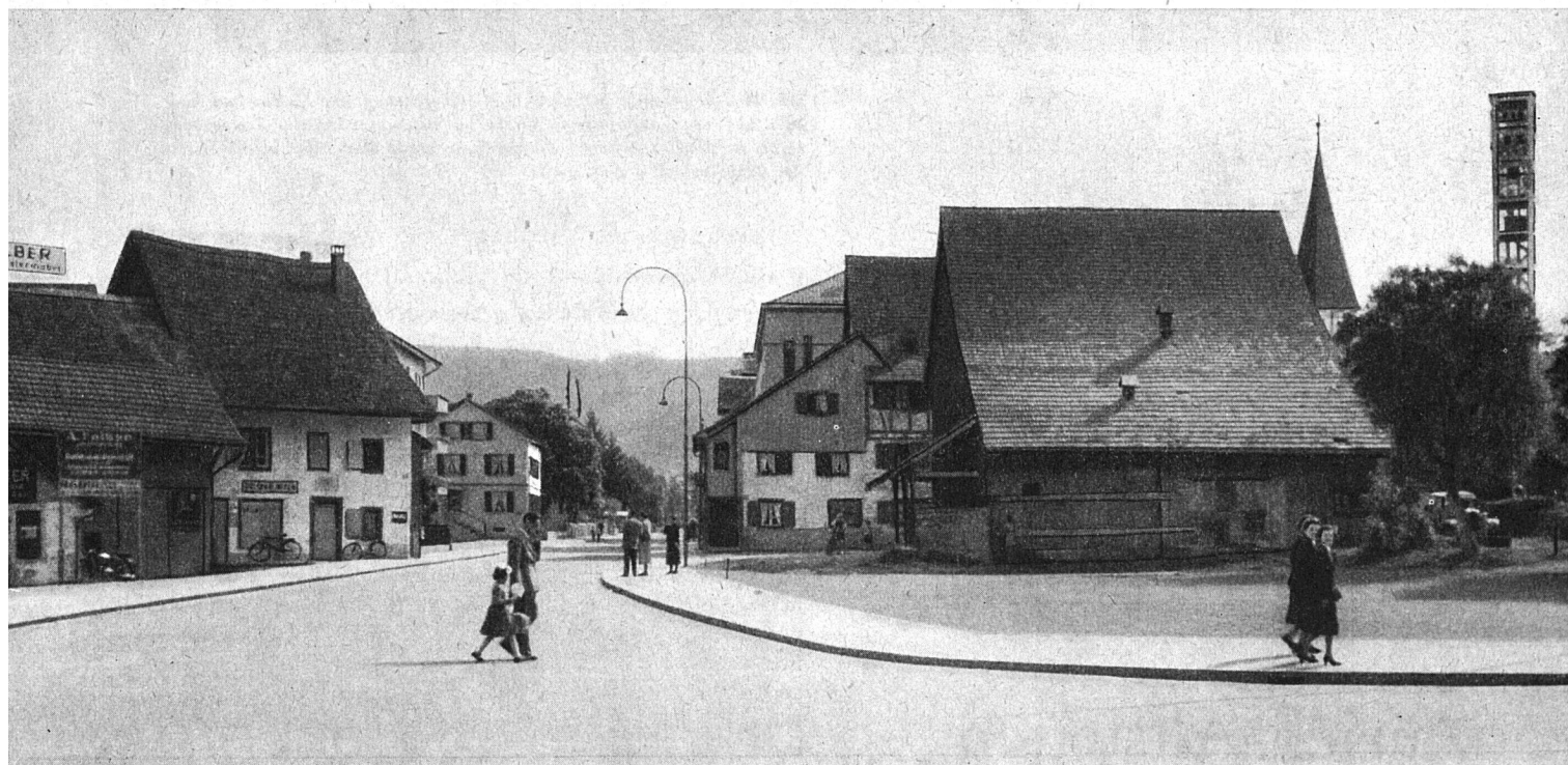
Links von der Altstetterstraße das erste, im 17. Jahrhundert erbaute kleine Schulhaus von Altstetten, das bereits vor einigen Jahren einem Neubau Platz machen mußte.