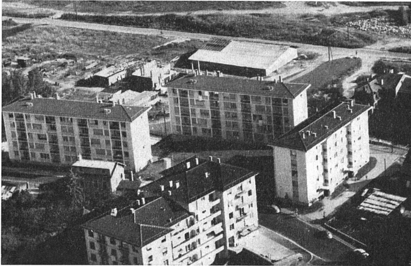
Logement ouvrier - Groupe de Montelly