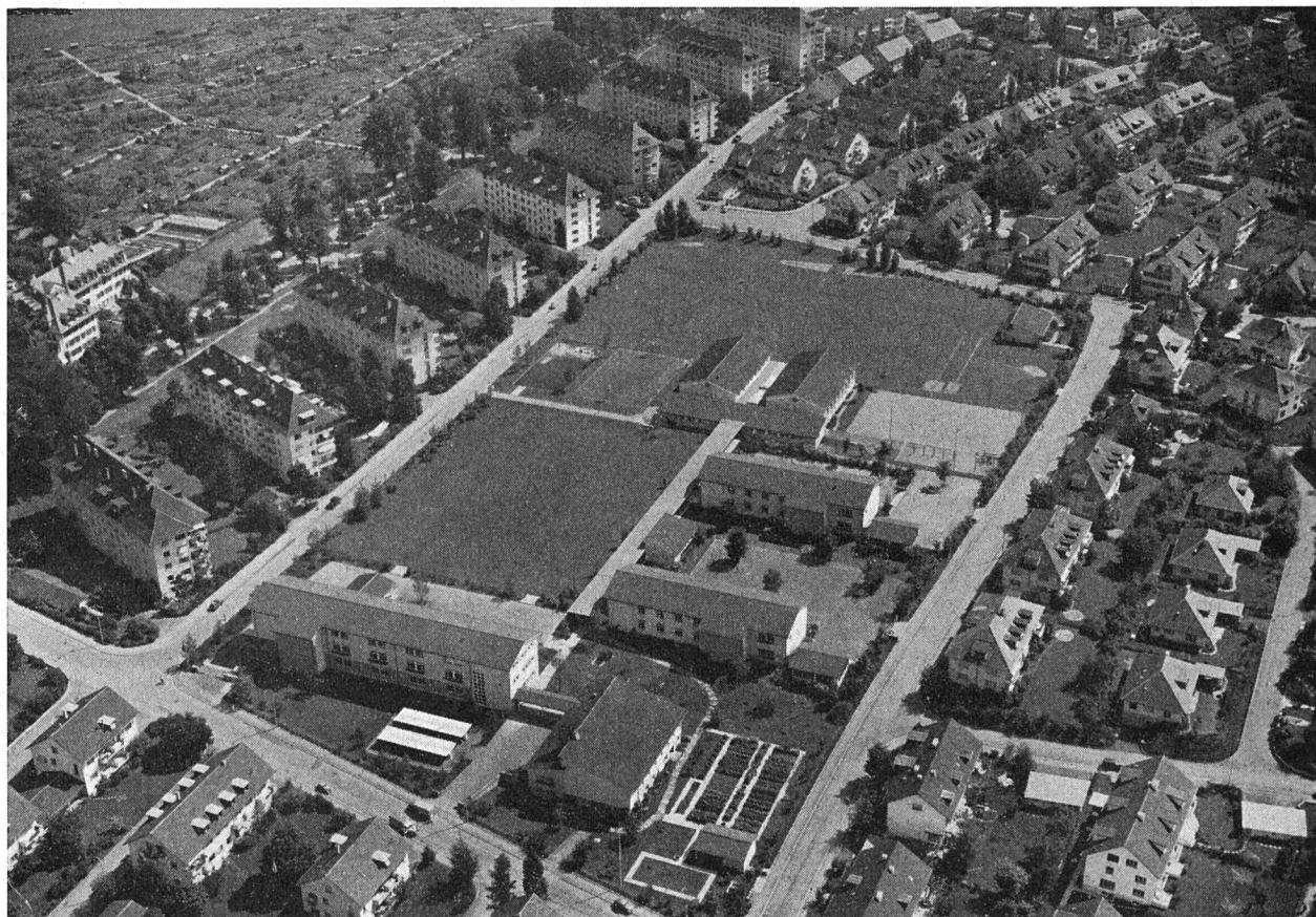
Schulanlage Unteres Murifeld, Beispiel einer Gesamtplanung von Schule und Wohnquartier