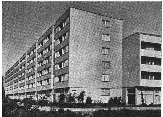
Wohnhausanlage «Schörghub», Böhmerwaldblock