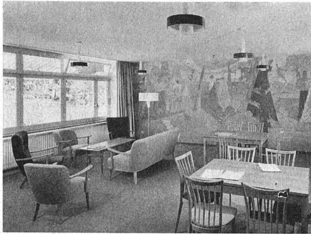
Alterssiedlung Waldgarten. Gemeinschaftsraum und Fernsehstube

besitzt ein eigenes WC mit Kaltwasserlavabo und Spiegel-Toilettschränklein. Das Wohnschlafzimmer von etwa 16 bis 17 Quadratmeter Bodenfläche weist einen kleinen Balkon auf. Die Bodenbeläge sind zweckentsprechend gewählt worden und bestehen in der Küche aus Sucoflor, einem Plastikmaterial, der außer dem gelegentlichen Aufwaschen mit lauwarmem Wasser keiner weiteren Pflege mehr bedarf, und im Wohnschlafzimmer aus Holzparkett, das versiegelt wurde und neben der behaglichen Atmosphäre, auf die besonderer Wert gelegt worden ist, gegenüber früher viel leichter sauber zu halten ist. Nur in den WC sind Steinplatten verwendet worden, die sich für alte Leute weniger in der Küche, wohl aber in den Aborten bewähren.