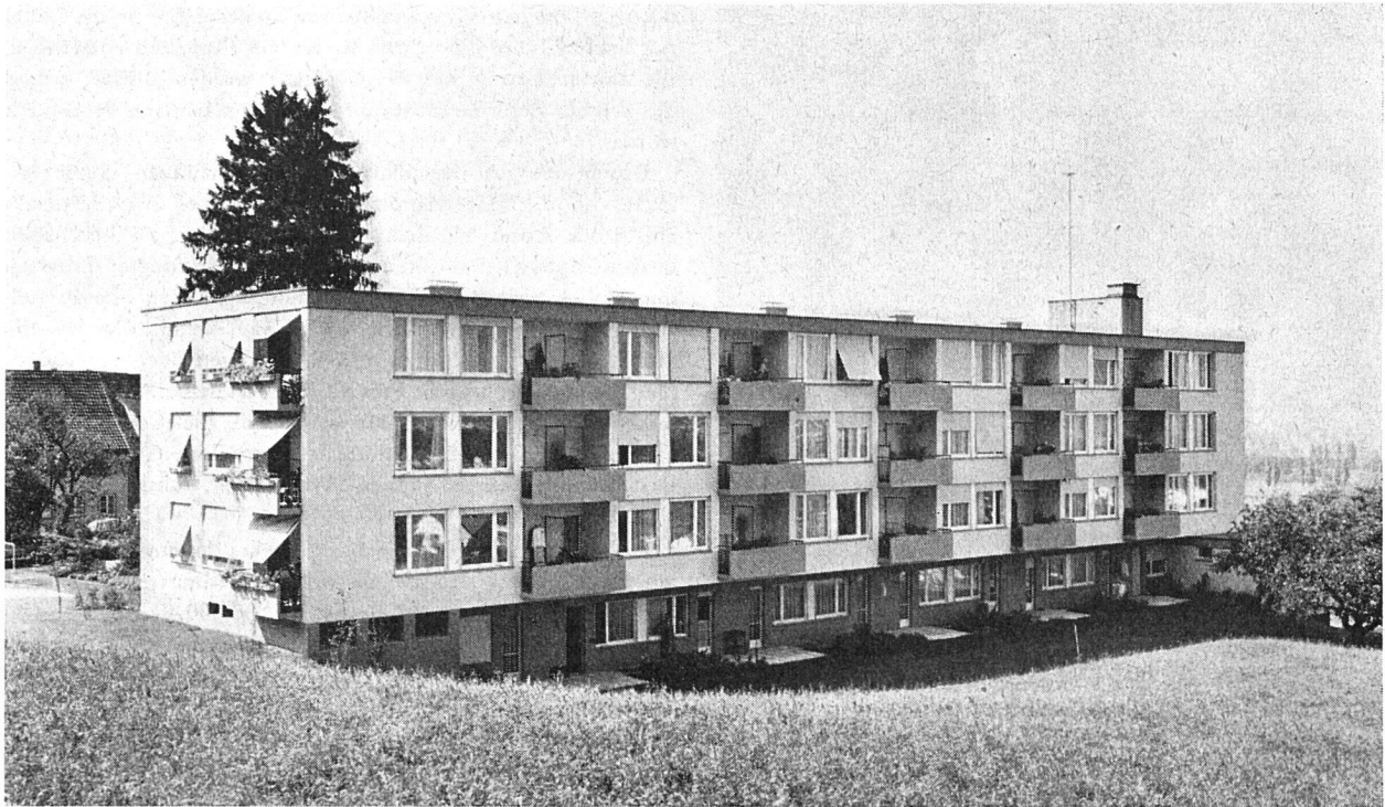
Alterssiedlung Waldgarten, Ansicht von Osten