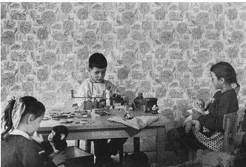
Eine fröhliche, abwaschbare Tapete im Kinderzimmer ist mitbestimmend für die Atmosphäre im Reich der Kinder. (Aus der Galban-Kollektion.)