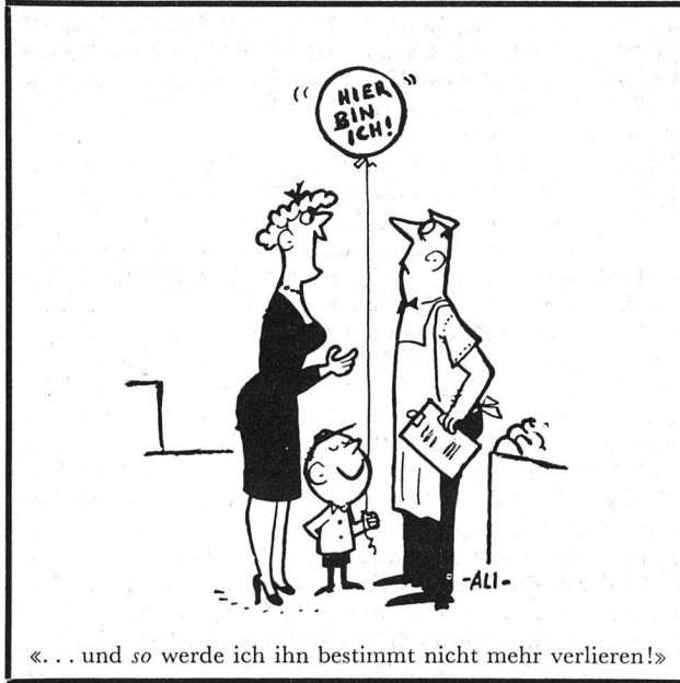
«... und so werde ich ihn bestimmt nicht mehr verlieren!»