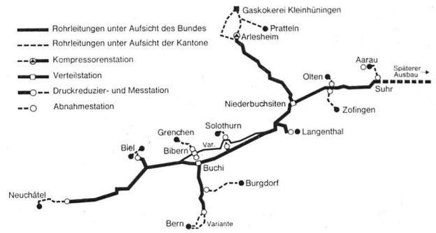
Das Trasse des vor der Ausführung stehenden Hochdruck-Transportnetzes der Gasverbund Mittelland AG mit Basel als vorläufig erster Produktionszentrale.

Die Anfänge der Konzentration der Produktion liegen bei der schweizerischen Gasindustrie schon recht weit zurück. Immer wieder haben kleinere Gasversorgungen sich entschlossen, die Eigenproduktion aufzugeben und das Gas von einem benach- barten größeren Werk zu beziehen. Auf diese Weise sind mit