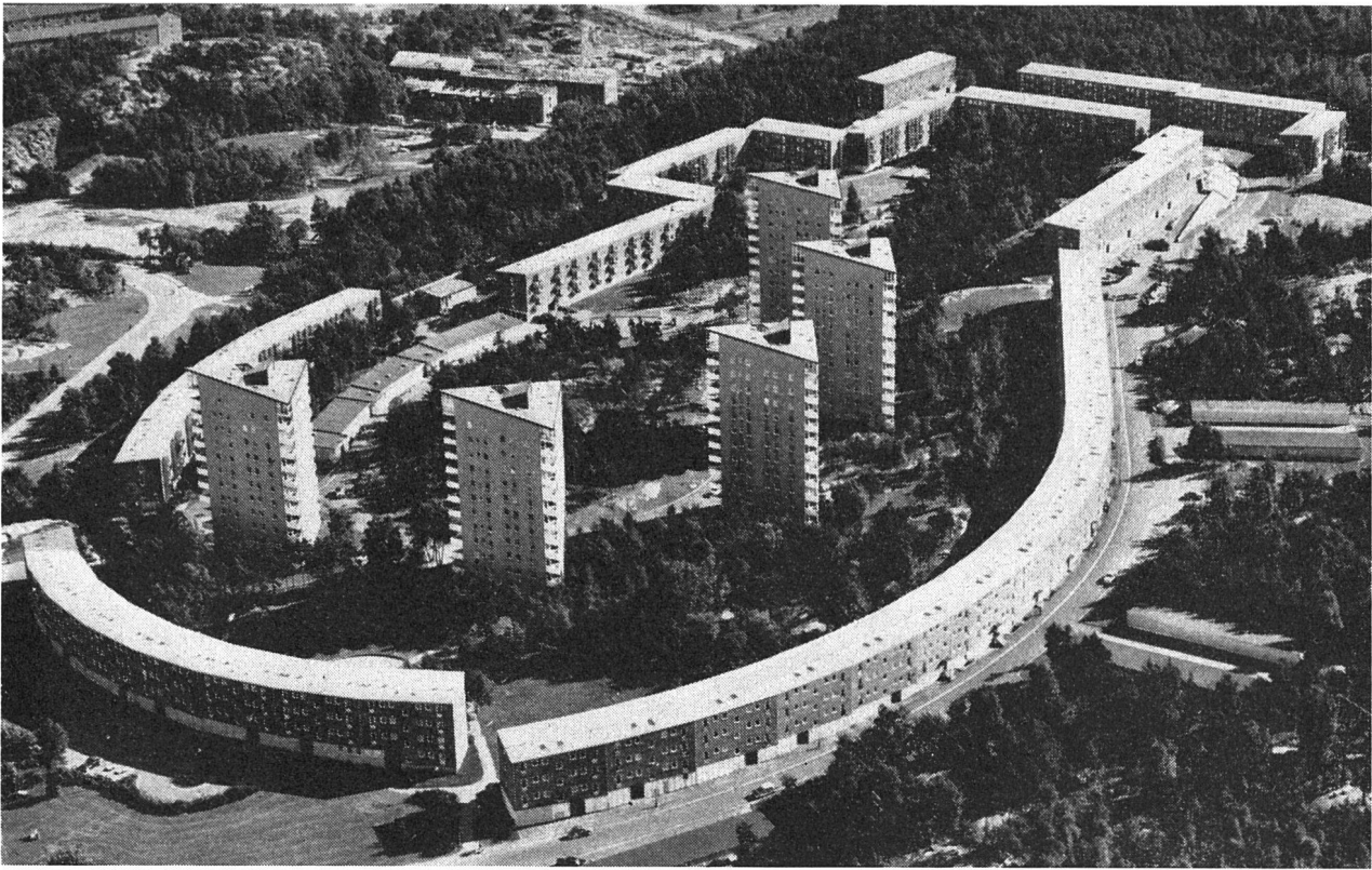
Moderne Wohnsiedlung in Kortedala, etwa 7 km östlich vom Zentrum Göteborgs