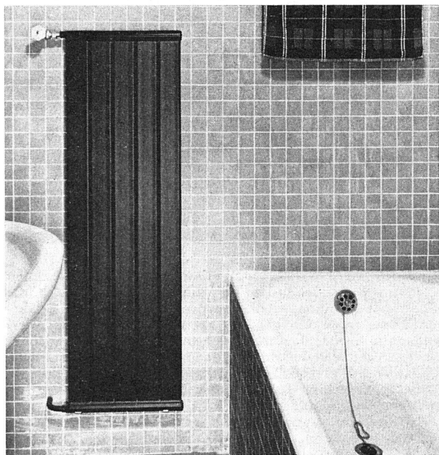
Für das Badezimmer ist als Wärmequelle die Heizwand zu empfehlen – vor allem wegen der milden Wärmestrahlung und der guten Reinigungsmöglichkeit. Weitere Vorteile: elegante Linienführung, platzsparend. (Runtal-Heizwand, Typ H.)