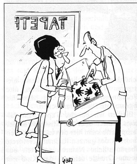
«...und für das Kinderzimmer empfehle ich Ihnen diese hier!»