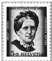
Johanna Spyri 1827-1901