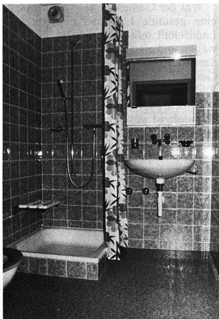
Auch Dusch- und WC-Raum wurden in jeder Wohnung mit viel Aufmerksamkeit für praktische Details eingerichtet.

Die Verwaltung wird von einer diplomierten Krankenschwester besorgt. Die Bewohner haben damit die Möglichkeit der Unabhängigkeit in der eigenen Wohnung und der Gemeinsamkeit in den Allgemein- und Mehrzweckräumen. Als solche sind eine grosse Gemeinschaftsküche, ein Aufenthaltsraum, welcher gleichzeitig als Esszimmer dient, ein eingerichtetes Sprechzimmer für Ärzte, ein Therapiebad und ein Turn- und Mehrzweckraum vorhanden. Die grossen Korridore eignen sich vorzüglich als Aufenthaltsräume.