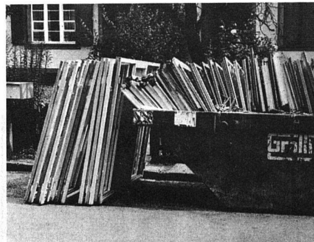
Hunderte von Fenstern sind innert weniger Tage ersetzt worden, und die alten, ausgedienten Vorkriegs-Fenster stehen zum Abtransport bereit. Resultat: mehr Komfort, weniger Energieverbrauch

den die Schlagregensicherheit, die Schallisolation und der Bedienungskomfort erheblich verbessert. -ieps-