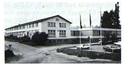
Das Fabrikgebäude der Berg-Küchen AG im thurgauischen Berg. Hier sorgen 55 qualifizierte Mitarbeiter für die Her- stellung hochwertiger und qualitativ her- vorragender Schweizer Küchen.

Eine kürzlich durchgeführte Markt- analyse ergab, dass die Berg-Küchen in der Öffentlichkeit relativ wenig bekannt sind. Mit der Eröffnung eines Show- rooms in Zürich soll in Zukunft diesem Missstand begegnet werden. Die ge- schmackvoll gestaltete und instruktive Ausstellung an der Beckenhofstrasse 6 in Zürich wurde kürzlich eröffnet. B -