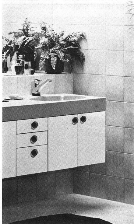
Oben: Moderner Waschtisch von heute