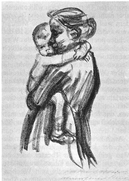
Käthe Kollwitz, «Mutter mit Jungen», 1931

stünde mit dessen Schicksal, dessen Bestand gegenüber Freud, Leid und Schuld, mit seinen Tugenden und Untugenden, darüber wollte er sich jetzt keine Sorgen machen, das überliess er getrost höheren Mächten wie auch der offensichtlich gesunden Natur seines Nachkommen.