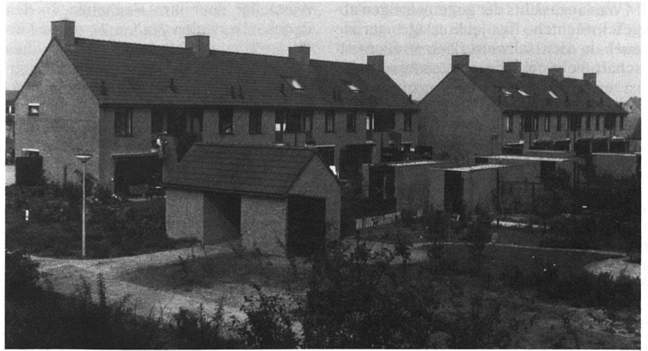
Reiheneinfamilienhäuser in Gasperdam, einen Aussenbezirk von Amsterdam. Die traditionelle niederländische Wohnbauweise ist hier in einer moder-

Von der Studienreise nach den Niederlanden, welche der SVW im letzten September veranstaltete, gibt diese Seite einige Eindrücke wieder. Als erstes besuchten die rund 70 Teilnehmer die neue Stadt Zoetermeer bei Den Haag. Ein Tag war sodann dem Kontakt mit Wohnbaugenossenschaften gewidmet. Einem Fachgespräch am Sitz des grossen holländischen Dachverbandes in Almere-Haven schlossen sich Besuche bei einzelnen Amsterdamer Genossenschaften an. Lebhaft und anschaulich gestaltete sich ein weiterer Tag, an welchem die Wohnbaupolitik der Stadt Amsterdam im Mittelpunkt stand.