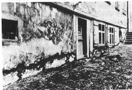
Situation 1959, vor Mauerentfeuchtung

In der Tat existieren aber Verfahren, die weniger von Schlagworten als von praktischer Bewährung leben. Ein Beispiel: Die Schweizer Elektrosmose/Elektrophorese-Mauerentfeuchtung nach den Patenten Ernst/Traber. Seit über 40 Jahren wird das Prinzip in der Schweiz realisiert. Als praktisches Beispiel zeigen