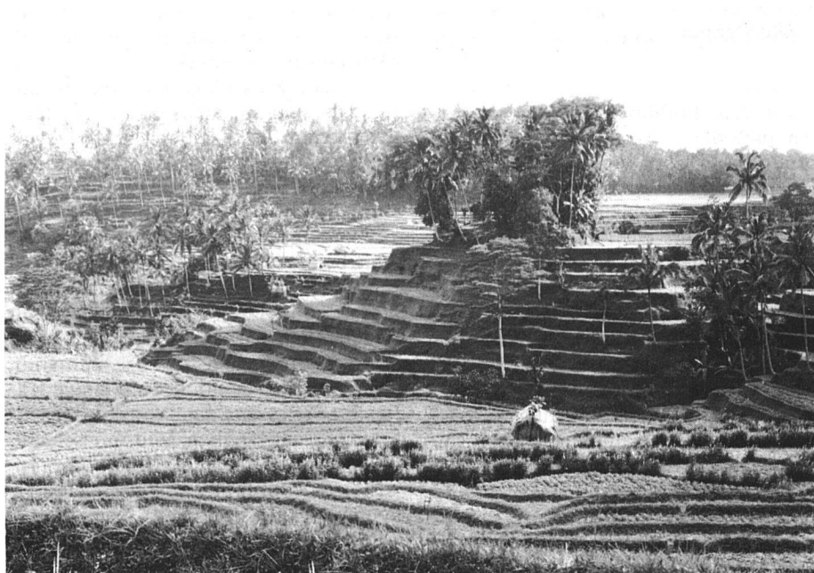
Faszinierender Ausblick: Reisfelder auf Bali

Die Reispflanze stellt hohe Ansprüche an den Nährstoffgehalt der Böden, an die Versorgung mit Wasser und an die Temperatur. Nur dort, wo die Temperatur zwischen 25 und 30° Celsius liegt, gedeihen die Pflanzen optimal. Der Trockenreis ist weniger empfindlich, er gedeiht noch auf 1800 Meter Hö-