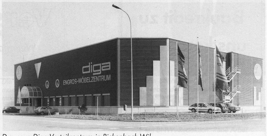
Das neue Diga-Verteilzentrum in Rickenbach-Wil

Nicht nur das Ziel, auch weiterhin der wichtigste Partner für den Fachhandel zu bleiben, hat sich die «diga» gestellt. Sie möchte diese echte Partnerschaft auch weiterhin mit ihrem gesamten sozialen Umfeld pflegen. Das heisst, dass die bisherige gute Zusammenarbeit mit Kunden und Lieferanten, Behörden und Organisationen und dem Personal auch weiterhin gehegt und gepflegt wird.