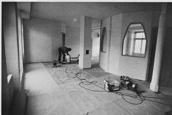
Kurz vor der Fertigstellung: Wohnung in der ehemaligen Fabrik

An offiziellen Kommissionen fehlt es uns. Wir haben nur eine wirklich funktionierende Kommission: den Vorstand. Erst kürzlich ist die Baugruppe dazugekommen; hoffentlich ist sie motiviert genug, viel Gratisarbeit durchzuhalten. Weil sich so wenige Untergruppen um die Details kümmern, diskutieren wir in der grossen Gruppe oft stundenlang: Wer bekommt welchen Gartenanteil? Wie gross muss ein Balkon werden, damit sich die Investition lohnt – und wie gross darf er werden, damit die Bewohnerinnen und Bewohner des untersten Stockes einverstanden sind damit? Wer trägt die Verantwortung für Fehler auf dem Bauplatz? Wer bezahlt die Extrawürste in den verschiedenen Wohnungen? Wer putzt den Gemeinschaftsraum? Wunderbar – wir dürfen bei all diesen Fragen mitbestimmen. Schrecklich – wir tragen bei jedem Entscheid Mitverantwortung. Kein Haus-