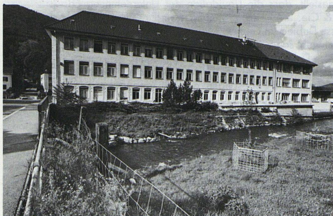
Früher Uhrenfabrik, heute Wohnfabrik: die Cortéga in Cortébert

Vier Jahre lang stand sie leer, jetzt ist sie wieder belebt: die ehemalige Omega-Uhrenfabrik in Cortébert (Berner Jura). Menschen haben sich in einer Genossenschaft zusammengetan, das Gebäude gekauft und daraus das Wohnprojekt Cortéga (aus Cortébert und Omega) gemacht. In der Cortéga entstehen bis Anfang 1991 zwölf Genossenschaftswohnungen.