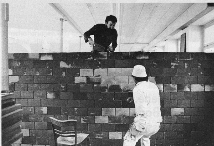
Grenzen setzen, auch in der Genossenschaft: Die Mauer wächst bis zur Decke und unterteilt eine riesige Fabrikhalle in zwei grosse Wohnungen

meister weit und breit, der dafür sorgt, dass der Müll wekommt und der Öltank rechtzeitig aufgefüllt wird! Keine Vermieterin in Sicht, bei der wir uns über die Nachlässigkeit des Hausmeisters beklagen könnten! Selber müssen wir uns am Kragen packen, wenn wir die leeren Versprechen unseres ehemaligen Architekten monatelang hingenommen haben! Lange Zeit wurde zu wenig unterschieden zwischen Eigeninteresse und Interesse der Genossenschaft; zudem verhinderten persönliche Verstrickungen und Sympathien eine klare Haltung der Genossenschaft als Bauherrschaft.