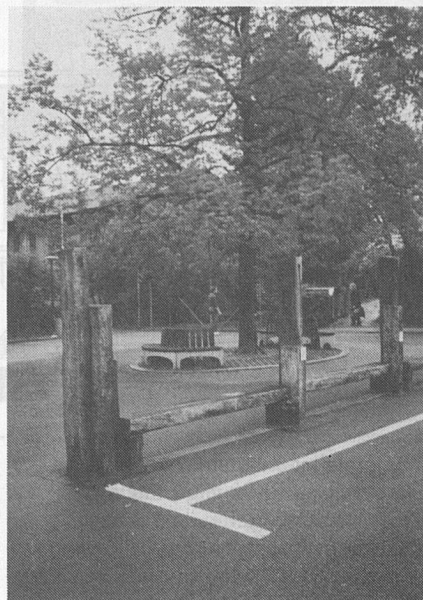
Nicht der Verkehr – der Mensch ist gegeben. Zone 30 – als flächendeckende Massnahme zur Beruhigung des Verkehrs in Wohnquartieren (links). Rückgewinnung von Lebensräumen (rechts). Ein ehemaliger Parkplatz wird zum Begegnungsraum.

«Verkehr» angepasst werden müssen. Verkehrserziehung heisst also nicht etwa, dass der Verkehr erzogen wird. Üblicherweise heisst es ungefragt, dass Kinder (und nur sie) erzogen werden. Den Verkehr kindgerecht machen wollen heisst demnach folgerichtig: Die Kinder, ihre Art, sich im Freien zu bewegen, ihre Freude an Bewegung und Kommunikation, ihre wachen Sinne für interessante Ablenkungen, werden als unveränderbar betrachtet. Eine Parole dafür heisst: «Kinder sind nicht klein zu kriegen.» Der Verkehr jedoch, auch und gerade der Motorfahrzeugverkehr, ist formbar, beeinflussbar. Die Menge des Verkehrsaufkommens, die Art der Verkehrsmittel, die Geschwindigkeit usw. sind variable Grössen. Beeinflussbar ist auch das Verhalten von Lenker/-innen der Fahrzeuge, zum Beispiel deren Aufmerksamkeit. Verkehrserziehung wäre dann plötzlich Erwachsenenbildung. Bloss: Welche Erwachsenen würden von sich selber aussagen, dass sie Erziehung brauchen? In der Tat dürften die Variablen des motorisierten Verkehrs letztlich einfacher zu beeinflussen sein als diejenigen der kindlichen Art zu leben. Da Verkehrserziehung jahrzehntelang nur als Anpassung der Kinder an den Verkehr verstanden wurde (und teils noch wird), da Verkehrsplanung fast immer – auch heute noch –