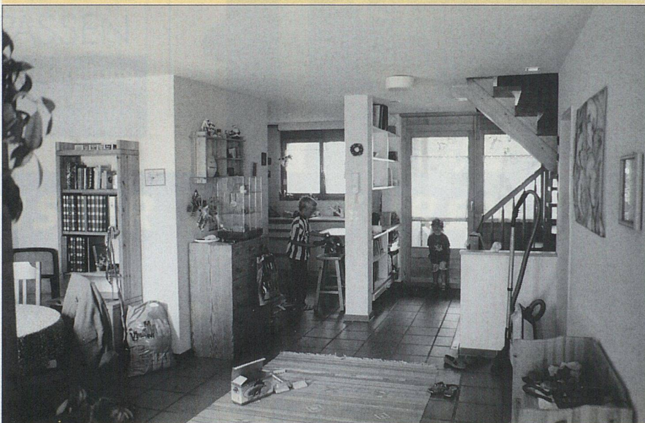
Wohngeschoss Wohnung 2

Wie aber verhält man sich, wenn in einer mehrgeschossigen Zone dieses Ziel nicht