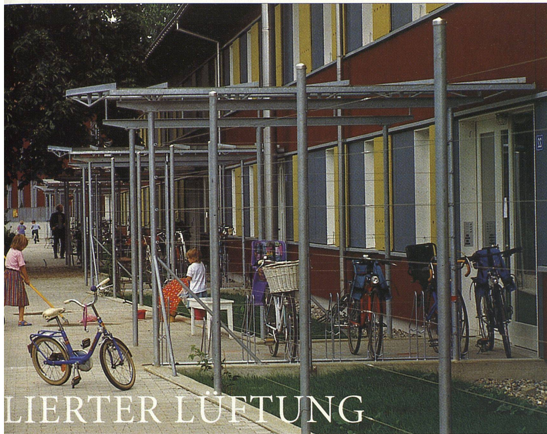
Siedlung «Niederholzboden» der Genossenschaft «Wohnstadt» in Riehen BS: Die Genossenschafterinnen und Genossenschafter bezogen ein energetisch ausgeklügeltes Gebäude, in dem 34 Wohnungen mit kontrollierter Lüftung ausgestattet sind. Im Bild: Eingangspartie mit zentralem Luftzufuhrrohr.

den. In der Küche bauten die Planer trotz des Absaugstutzens noch ein Umluftgerät ein. Dieses mit einem Aktivkohlefilter versehene Gerät entnimmt der Luft die Fettpartikel. Die Lüftungsleitungen werden dadurch weniger mit Fett belastet. Geheizt wird die Siedlung durch einen Gasheizkessel mit Abgaskondensation. Die Wärme wird durch hohe schlanke, an den Innenwänden platzierte Heizkörper an die Räume abgegeben. Die Heizkörper konnten an den Innenwänden platziert werden, weil die Fassade gut wärmedämmend ist. Jeder Heizkörper verfügt über eine Einzelraumregulierung, die von einem Raumthermostaten angesteuert wird. In einem Einbaukasten im Korridor befindet sich der Wärmehzähler.