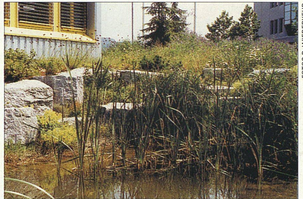
Lösungsvarianten: Biotop mit Randüberlauf (oben) und begrünte Sickermulde (unten).