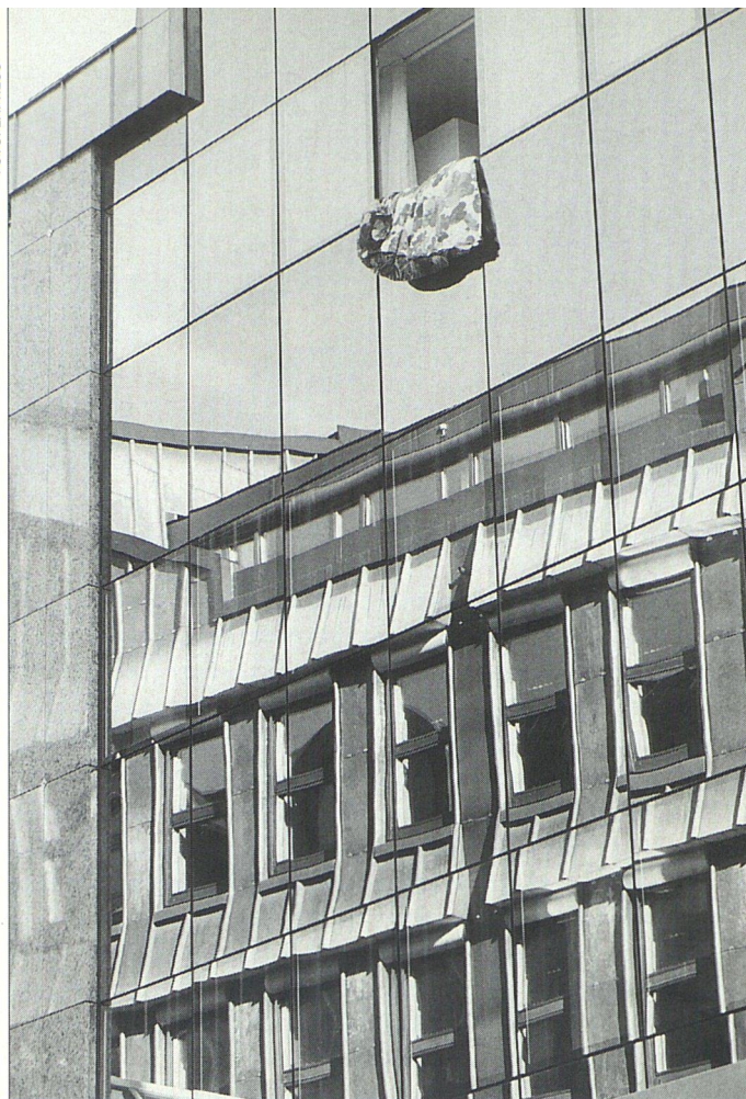
Verschiedene Gläser und Rahmenmaterialien prägen unsere Fensterlandschaft.

Gebräuchlich sind Doppel- und Isolierverglasungen eingebaut, die einen k-Wert von 2,9 \text{ W/m}^2\text{K} haben. Würden diese Fenster durch Wärmeschutzgläser ersetzt, so könnten bei einer Glasfläche von 30 \text{ m}^2 ein paar hundert Liter Öl pro Jahr gespart werden.