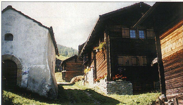
Ob sportliche Betätigung oder kulinarisches Geniessen: Im Hotel Alpenhof, Unterbäch VS, finden Sie alles unter einem Dach und dazu die einzigartige Naturlandschaft des Wallis.