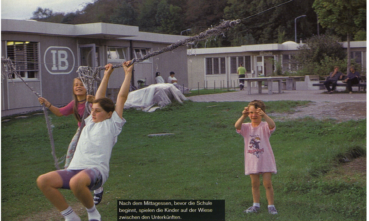
Nach dem Mittagessen, bevor die Schule beginnt, spielen die Kinder auf der Wiese zwischen den Unterküften.

trauma leiden. Die Heimbewohner/innen dürfen ausserdem das Hallenbad der Klinik benutzen.