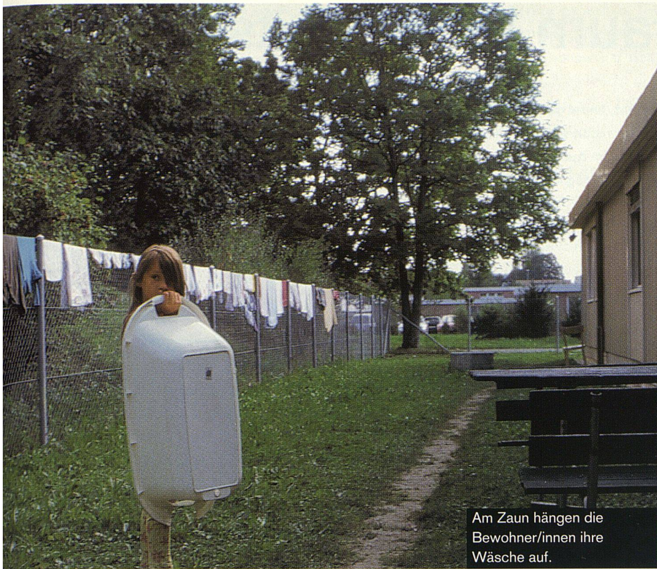
Am Zaun hängen die Bewohner/innen ihre Wäsche auf.