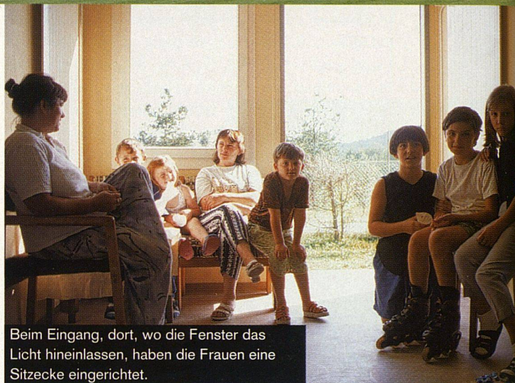
Beim Eingang, dort, wo die Fenster das Licht hineinlassen, haben die Frauen eine Sitzzecke eingerichtet.

Im Zürcher Unterland, eingebettet zwischen die Abhänge des Blauen und des Dettenberges, liegt Embrach, ein Dorf mit 7000 Einwohner/innen. Die Psychiatrische Klinik Hard mit Personalhaus, eine Drogenentzugsstation und zwei Durchgangsheime für Asylbewerber/innen gehören ebenfalls zum Ort. Die Bahnlinie, eine Hauptstrasse und die Industrie schneiden sie allerdings vom Dorf ab, so ist ein eigentliches Ghetto entstanden.