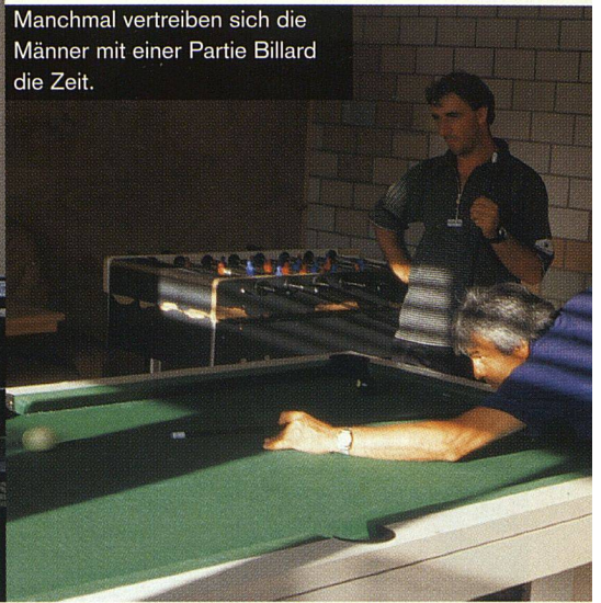
Manchmal vertreiben sich die Männer mit einer Partie Billard die Zeit.

arbeiten dürfen die Asylbewerber/innen von Gesetzes wegen nicht. Langweilig muss es ihnen trotzdem nicht werden: Jeder kann sich im Zentrum für einen Dienst melden: Putzen, die heimeigenen Velos vermieten, die Abfälle entsorgen oder den kleinen Laden betreiben. Die Bewohner/innen sorgen auch selbst für den Unterhalt ihres Heims, reparieren Schäden, streichen Wände und gestalten den Garten. «Wir wollen die Fähigkeiten der Leute erhalten und fördern. Damit verbessert sich ihr Selbstwertgefühl, was ihnen auch bei einer Rückkehr zugute kommt», nennt Ursula Schlatter als Ziel.