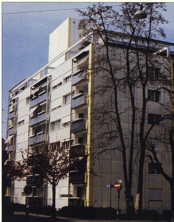
Das Farbkonzept erarbeitete der Zürcher Künstler Gottfried Honegger.

FIRMA IST VERSCHWUNDEN Am 19. Juni 1992 feierte die Baugenossenschaft die gelungene Sanierung. Ver- schiedene Redner lobten die Renovation, insbesondere auch die vorgehängte Email-Fassade, die der Künstler Gottfried Honegger abschliessend farbig gestaltet hatte. Rundum sah man zufriedene Gesichter.