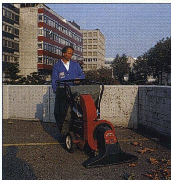
Die Serviceunternehmen sind punktuell und oft mit Maschinen präsent.