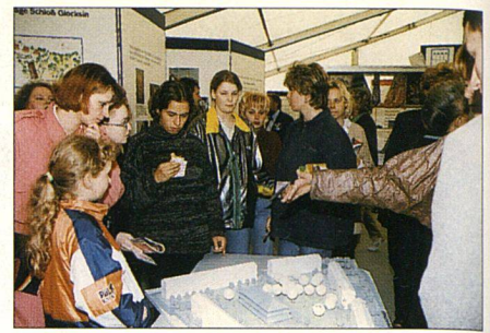
Gross und Klein spricht man verschieden an.