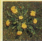
Löwenzahn Zähe, mehrjährige Pflanze. Die kräftige Pfahlwurzel dringt oft tiefer als 50 cm in den Boden ein.