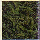
Schafgarbe Die gefiederten Blätter bilden am Boden eine Rosette und rauben so dem Rasen den nötigen Platz.