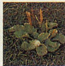
Breitwegerich Die 7–14 cm breiten Blätter liegen rosettenförmig am Boden und nehmen dem Rasen die Möglichkeit zur Ausdehnung.