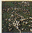
Gänseblümchen Schön, aber gefährlich. Diese mehrjährige Unkrautpflanze verdrängt schnell die Rasengräser und zerstört damit den wertvollen Rasenteppich.