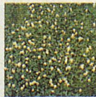
Weissklee Klee erstickt im Rasen die gewünschten Gräser, macht die Rasenflächen fleckig und anfällig gegenüber Belastungen.